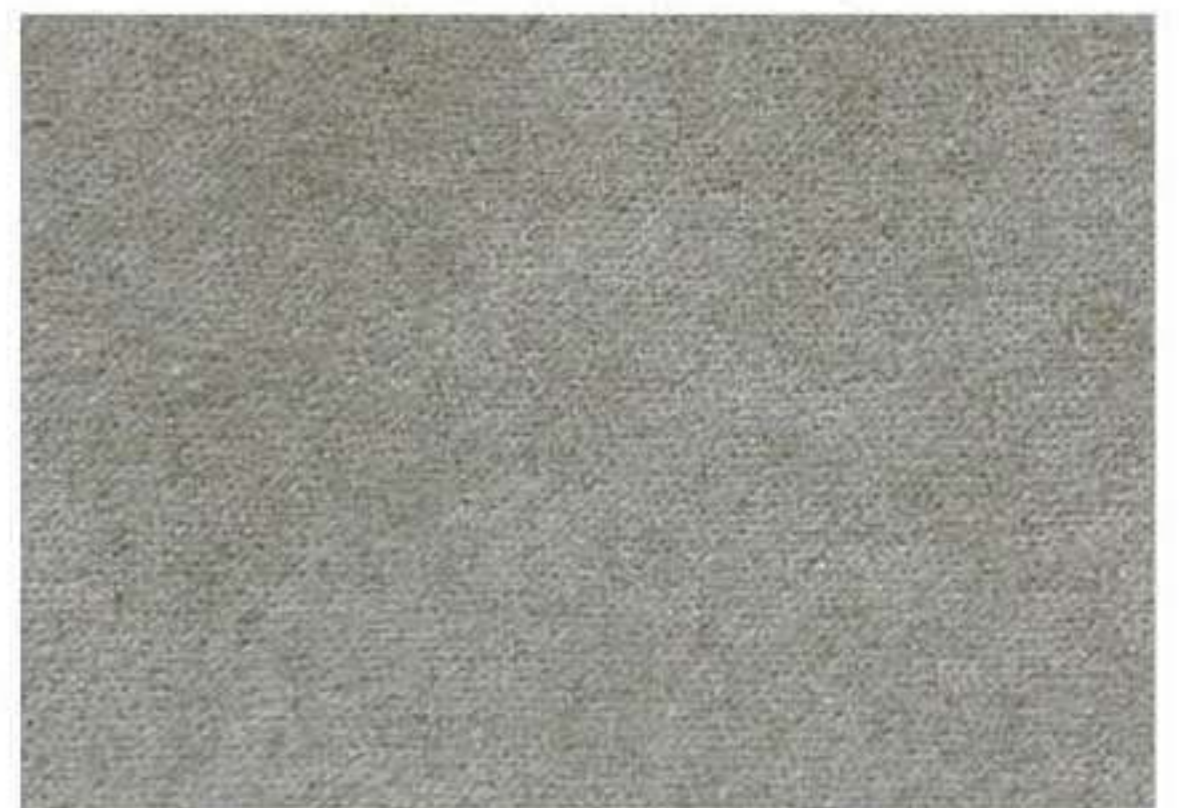
Trama del tessuto