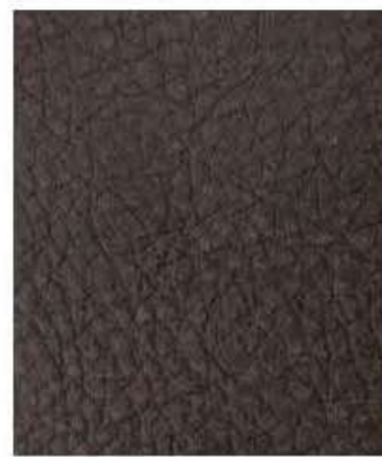
Testa di Moro