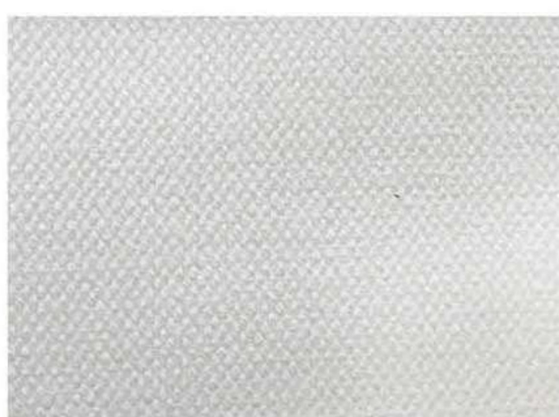
Trama del tessuto