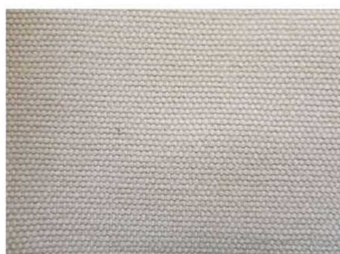
Trama del tessuto