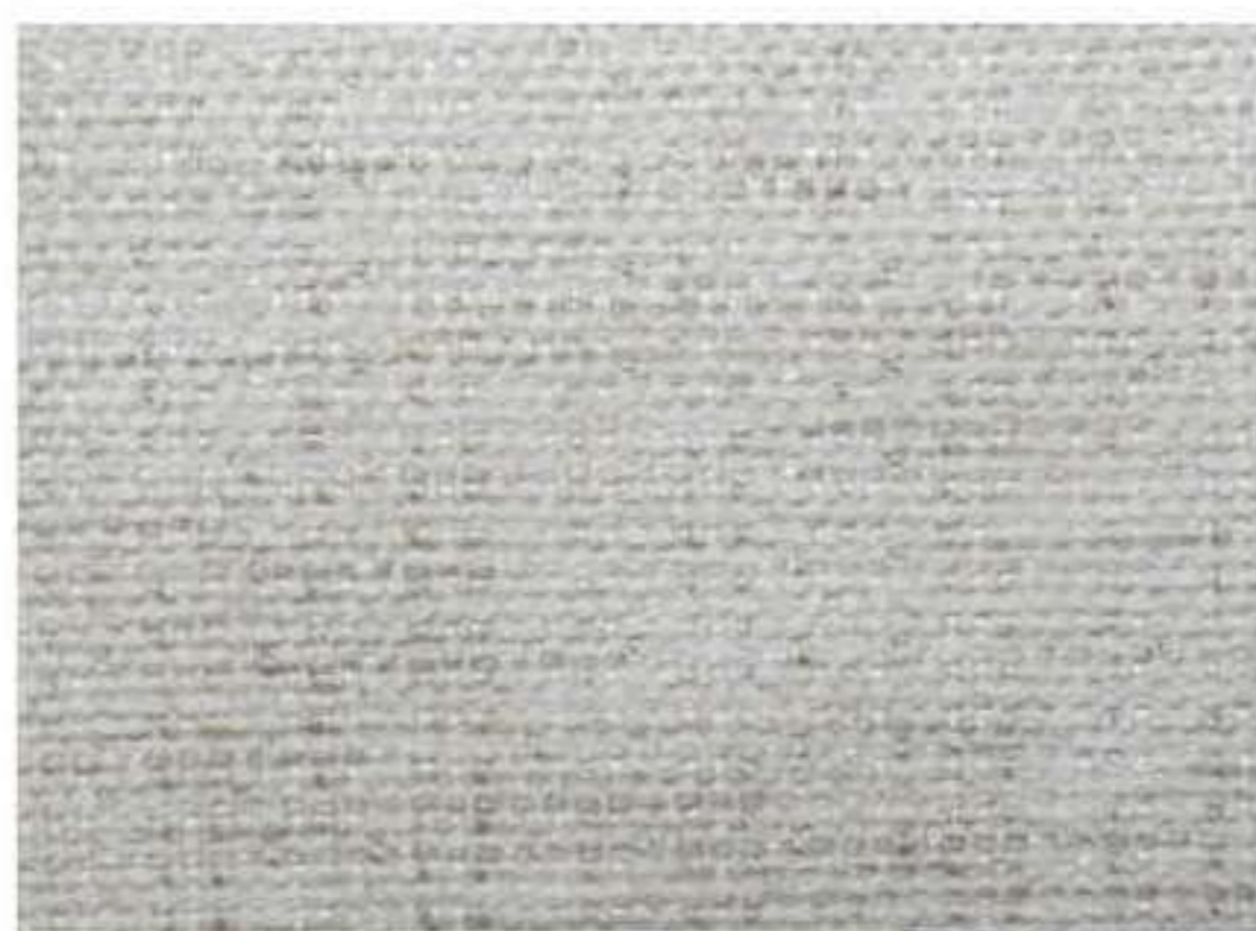
Trama del tessuto