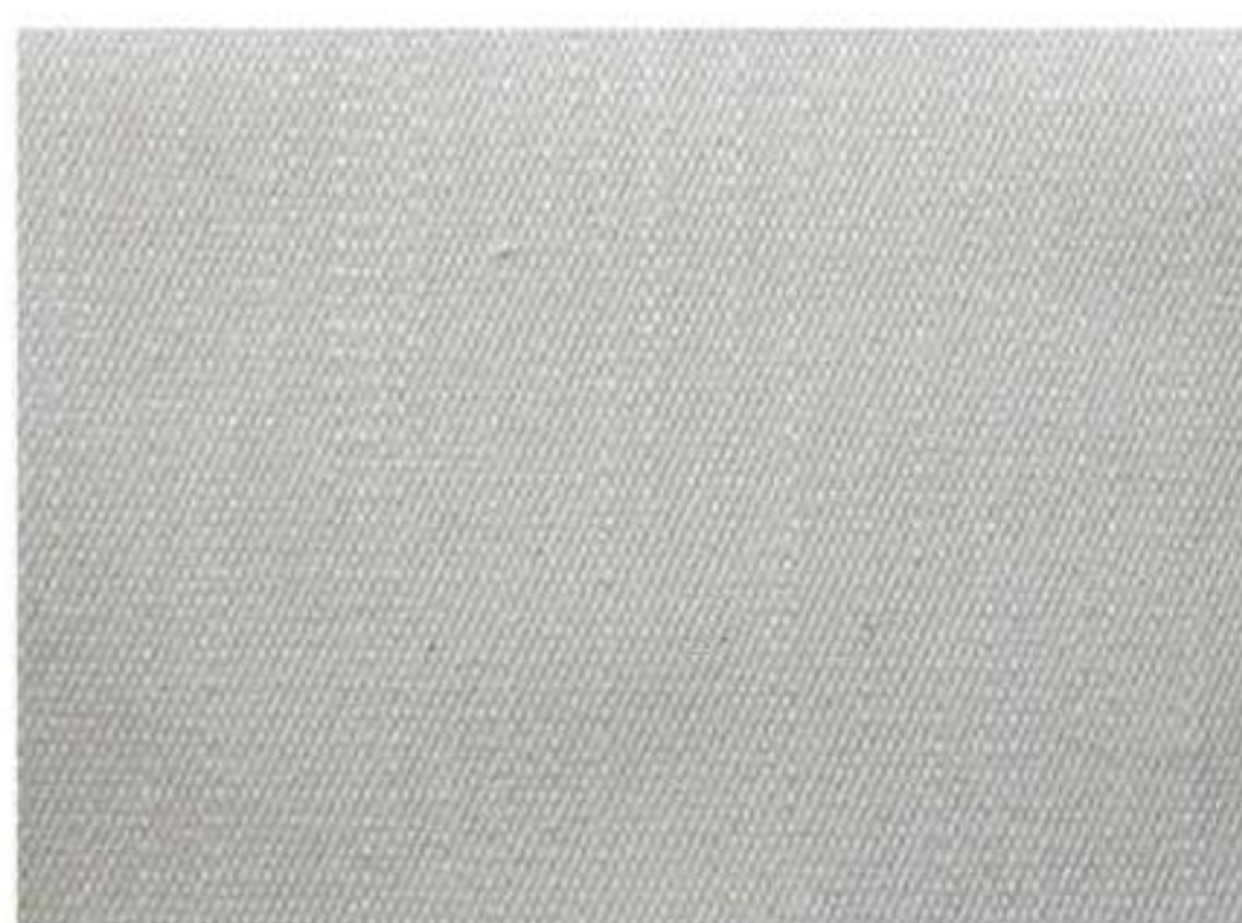
Trama del tessuto