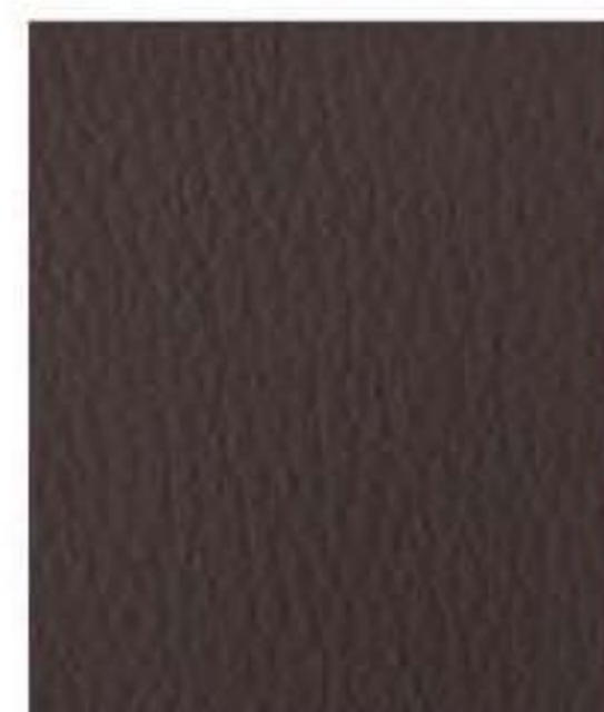
Testa di Moro